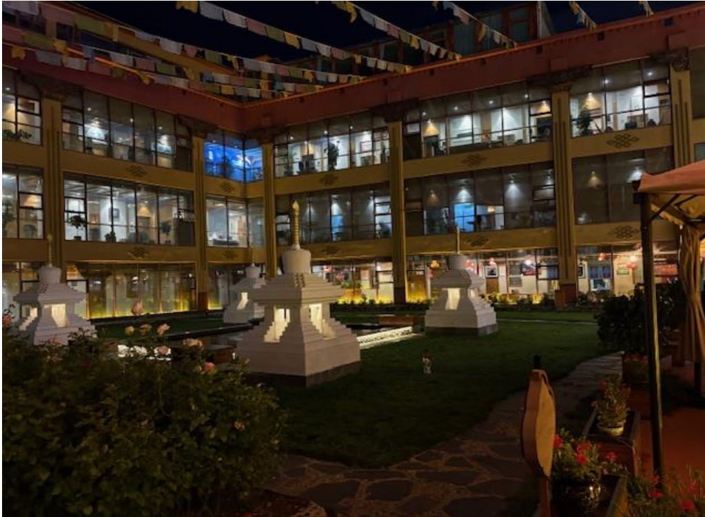
Ulica Barkhor (Lhasa)